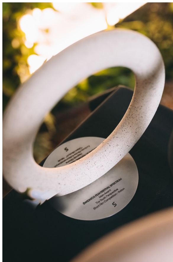
Koncepcja i wykonanie statuetek / Zakwas Studio

W sobotę 30 października zakończyła się 7 edycja Świdnickiego Festiwalu Filmowego Spektrum. Podczas uroczystej Gali Zamknięcia, która poprowadził dziennikarz Jan Pelczar, poznaliśmy tegorocznych laureatów. Wręczono nagrody w konkursach filmów krótkometrażowych Okiem Młodych dla młodych twórców, gdzie w każdej z konkursowych sekcji (Fabuła, Dokument, Animacja, Amatorski) swojego faworyta wybiera trzyosobowe jury, w którego skład wchodzi przedstawiciele świata filmu i sztuki. Oprócz jury głównego, filmy oceniało również jury lokalne: konkursowe fabuły oglądali uczestnicy terapii zajęciowej w Mokrzeszowie, sekcję dokumentalną skład złożył z osadzonych w Areszcie Śledczym w Świdnicy, konkurs amatorski przedstawiciele Młodzieżowej Rady Miasta Świdnica – a w konkursach pełnych metraży jedynym jury była festiwalowa publiczność!